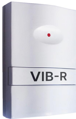
Рис. 1. Внешний вид извещателя

Настоящее Руководство по эксплуатации (далее – РЭ) является объединенным документом с паспортом на изделие