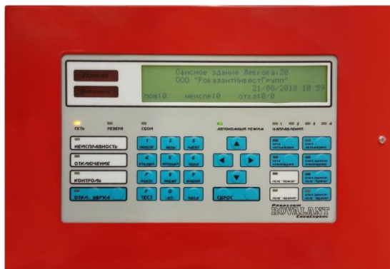
Рис. 1 Внешний вид лицевой панели ВПУ-40