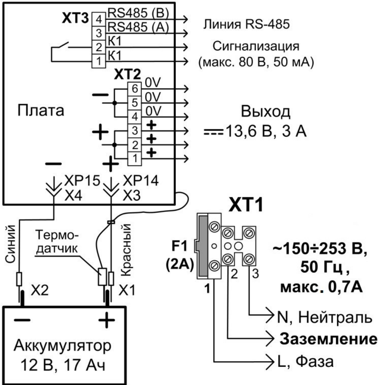
Схема подключения РИП