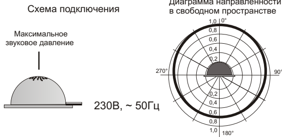
Рис.2 Схема подключения и диаграмма направленности оповещателя.

5.3. На рис.2 показана схема подключения и диаграмма направленности звука оповещателя.